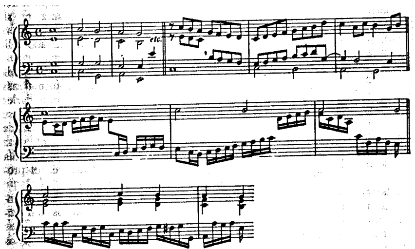
EJEMPLO 18.—Sweelinck: Variaciones del coral, Hertzlich lieb.

Las variaciones sobre melodías de salmos y corales suponen el inicio del coral para órgano. Sweelinck logró que la técnica de la variación profana de los virginalistas sirviese para un propósito litúrgico. Los calvinistas creían que el éxito mundano era el indicio de una salvación después de la muerte. El significado litúrgico del salmo y el coral dio a la técnica de la variación una dignidad religiosa basada en la creencia de que el esfuerzo de la elaboración era una prueba de mayor devoción. Cada variación tenía una riqueza de pautas, ritmos y motivos de contrapunto, mientras el cantus firmus, inalterable, se mantenía distante de las voces que lo rodeaban.