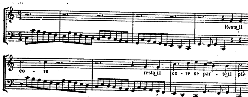
Legrenzi: aria de Totilo

Los logros conseguidos por Cavalli y Cesti alcanzaron su expansión en una generación posterior de compositores venecianos que incluye tres grandes maestros: Legrenzi , Stradella y Pallavicino . En su música el retorno del contrapunto se hizo cada vez más claro tanto en la textura de los conjuntos como en los comienzos con lema que consiste en la presentación de un motivo plástico que resume el efecto esencial del aria