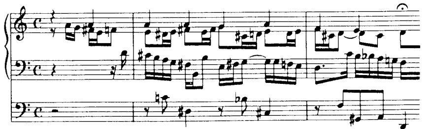
EJEMPLO 12 ★ Preludio de coral Durch Adams Fall, de Bach

Los corales organísticos posteriores son de mayores proporciones y son menos íntimos y subjetivos, sustituyendo los detalles expresivos por un desarrollo puramente musical de ideas.